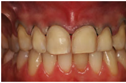
الشكل ٧: تحضير الأسنان الأمامية العلوية مع كشف حواف التحضير العنقية باستخدام خيوط التباعد اللثوي تمهيداً لأخذ الطبعة.