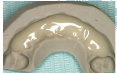
الشكل ٥: تصنيع التعويض المؤقت باستخدام مادة الإكريل البارد الخالي من المواد المألثة .VITA VM CC

يتقابل المريض مع فني الأسنان - دعوة مفتوحة للعمل برؤية فني الأسنان الخاصة والتي قد تؤدي في بعض الأحيان إلى عدم رضى المريض عن النتيجة النهائية للعمل المخبري .