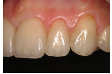
الشكل ١٤: الانطباع العام للوجوه الخزفية مع حدود قاطعة متجانسة بنسب متجانسة للأسنان على حد سواء.