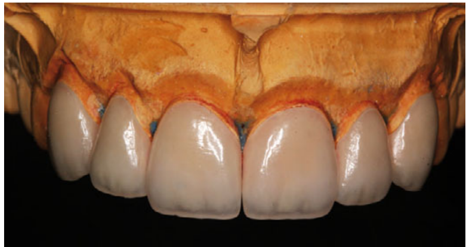
الشكل ١٠: الوجوه الخزفية النهائي على المثال الجبسي حيث يمكن ملاحظة الشفافية وتحسن تناظر شكل الحواف القاطعة مقارنةً بالحالة الأولية.

معرفة فني الأسنان الذي يقف وراء تصنيع وجه خزفي معين. يشبه ذلك إلى حد كبير مصففي الشعر عندما يغادر الزبائن بتسريحات شعر مميزة متماثلة. يعتبر الروتين اليومي - حيث لا