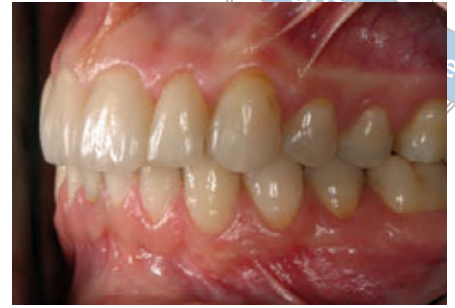
الشكل ١١، ١٢: يُظهر المنظر الجانبي للوجوه الخزفية المتطابق اللوني مع الأسنان الطبيعية، كما أنّ السطوح الخزفية مماثلة لحد كبير لسطوح الأسنان الطبيعية.