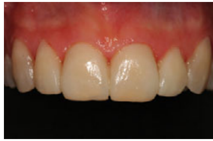
الشكل ٦: أخذت بعين الاعتبار رغبات المريض عند تصميم التعويض المؤقت والتي يمكن اعتبارها كدليل لتصنيع الوجوه الخزفية النهائية. يُبدي التعويض المؤقت تناظراً في شكل الأسنان وحوافها القاطعة.