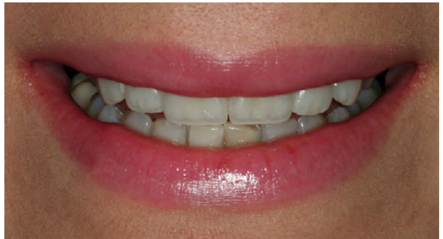
الشكل ١٥: تُظهر الحالة النهائية ضمن الغم الحدود القاطعة المتجانسة مقارنةً بالحالة الأولية وينسب مثالية مع خط الشفة.

يتم تصنيع التعويض المؤقت باستخدام مثال التشميع التشخيصي كقاعدة مع مادة الإكريل البارد (VM CC/VITA) كما هو مبين في (الشكل ٥). إضافة إلى خصائص حماية الأسنان المذكورة أعلاه يمكن هذا التعويض المؤقت