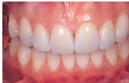
الشكل ١٥: الحالة بعد ثلاث سنوات من المتابعة.

يتم تشكيل الوجوه الخزفية بشكل مطابق للشكل التشريحي لمثال التشميع Wax-Up. للحصول على المظهر الطبيعي لفصوص الأسنان