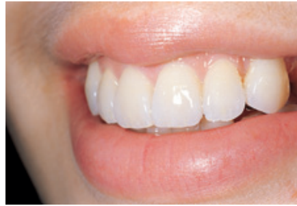
الشكل ١٤: خط الابتسامة كما هو موضح بالصورة الجانبية.