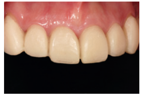
الشكل ١١: التعويض الإكريلي المؤقت للأسنان الأمامية.

الهرباء chameleon effect. متوفرة في سبائك ما مجموعه اثنا عشر سبيكة ذات سبعة درجات شفافية مختلفة تستخدم في عديد الحالات كالوجوه الخزفية والحشوات الضمنية Inlays والحشوات المغطية للحدبات Onlays والتيجان الجزئية partial crowns والتيجان الأسنان الخلفية والأمامية.