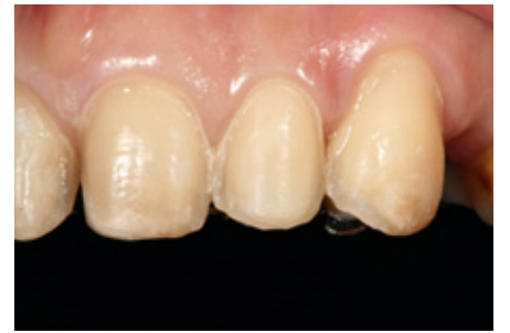
الشكل ٩، ١٠: تفاصيل التحضير النهائي للأسنان.