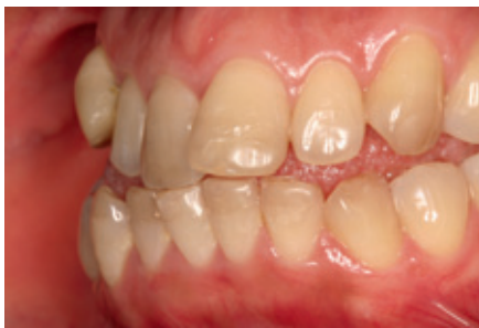
الشكل ١-٣: أسنان المريضة المتلونة وشديدة الازدحام تحتاج إلى معالجة تقويمية قبل البدء بإجراءات المعالجة التجميلية .

راجعت مريضة بعمر ٢٩ عاماً العيادة تشكو من تلون الأسنان المعالجة الأمامية العلوية والسفلية. طلبت الحصول على وجوه تجميلية خزفية بعد أن خضعت لعدة جلسات تبييض الأسنان والتي لم تساعد المعالجة في تحسين تلون الأسنان . علماً بوجود حالة من ازدحام الأسنان المرافق لسوء إطباق الأسنان و لذلك كان لابد من البدء بإجراءات تقويم الأسنان قبل البدء بالمعالجة التجميلية (الشكل ١-٣). فتمت إحالتها لإختصاصي تقويم الأسنان كمرحلة أولى.