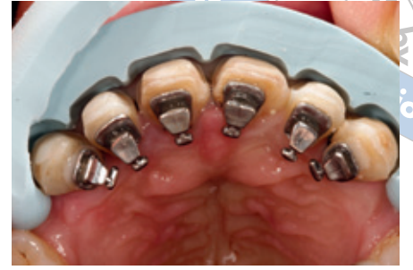
الشكل ٨: تحديد مقدار التحضير السني بالاستعانة بالدليل السيلكوني للمثال المشمّع.

يتم تشكيل الوجوه الخزفية بشكل مطابق للشكل التشريحي لمثال التشميع Wax-Up. للحصول على المظهر الطبيعي لفصوص الأسنان