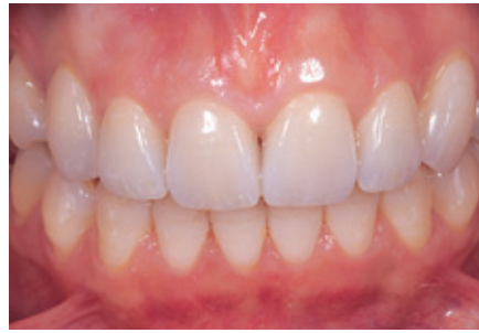
الشكل ١٣: الوجوه التجميلية ذات اللون A1.5