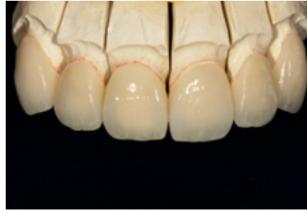
الشكل ١٢: الوجوه الخزفية IPS Empress ذات الجمالية العالية على المثال الجبسي.