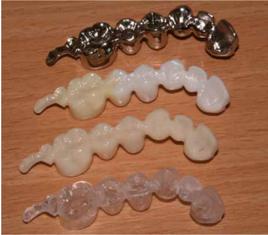
صورة ١: شيء للجميع- عالج Tizian ثاني أكسيد الزيركون إطباقيا، ثاني أكسيد الزيركون، كمبوزيت، شمع ومادة لدنة كاملة الاحتراق و PMMA.