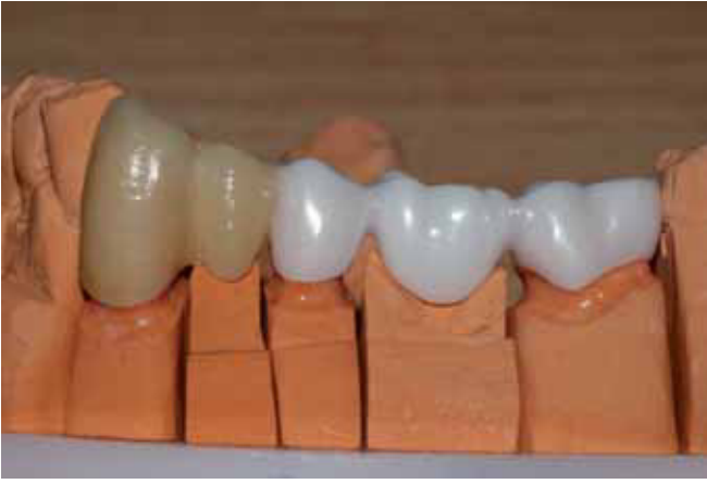
صورة ٥: بديل أبيض- قدم فني الأسنان Anger ثاني أوكسيد زيركون أبيضاً نقياً كبديل لهياكل المعدن غير الثمين الفضية ودمج الوصلات الضفيرية لدى تباين خطوط الادخال.