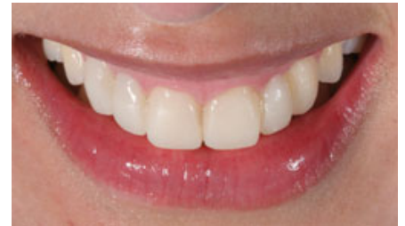
الصورة ١٧، ١٨: صور قريبة للترميم المؤقت.