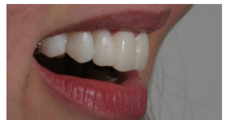
الصورة ١٩: مظهر جانبي من اليمين.