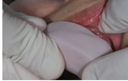
الصورة ١٤: إعادة تركيب الطبعة المملوءة.