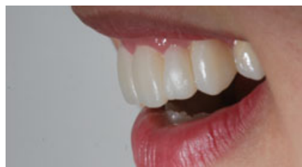
الصورة ٢٠: مظهر جانبي من اليسار.