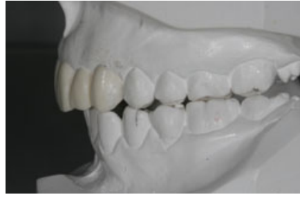
الصورة ١٢: الجانب الأيسر للطبعة الشمعية.

من الناحية الطبية السنية ظهر أن المرحلة الأولى لإظهار النتائج النهائية كانت مكلفة بالنجاح التام. فقد حصل المريض والطبيب بذلك على فرصة تجريب النتائج النهائية دون الإضرار للقيام بأي إجراءات جراحية. في هذه الحالة كانت المريضة موافقة كلياً على الإجراءات اللاحقة لتحقيق النتائج النهائية.