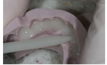
الصورة ١٣: ملء طبعة السيليكون.