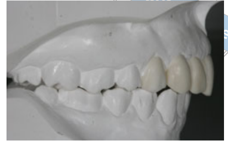
الصورة ١١: الجانب الأيمن للطبعة الشمعية.