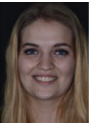
المریضة: تلبیس بالكسوات الخرزفیه فی مقدمة الفك العلوی