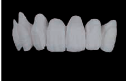
الحالة ٢: جسر مكسو جزئياً الصورة ٣ و٤: تطبيق جزئي لجسر من ١٤ حتى ٢٣، في الصورة قبل وبعد التليد: هنا استعمل أكسيد الزركون الملون .Cercon ht medium