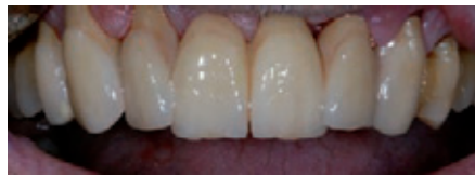
الصورة ٧: الجسر المكسو جزئياً بعد تركيبه في فم المريض.

ماهي المخاطر التي ستختار هذا الحل في المستقبل برأيك؟ هل هي المخاطر الكبيرة التي يزداد عددها في السوق في زمن التصنيع بأسلوب CAD/CAM؟ Bartsch: مع بعض التحفظ بالنظر لعدم قدرة أي منا على التنبؤ بمستقبل طب الأسنان في السنوات العشرة أو العشرين القادمة، فإنني أقيم الأمر بالشكل التالي: أنا أعتقد أن حجم المخبر سيبقى ظاهرة إقليمية. ففي بعض المناطق هناك مخابر كبيرة، بينما يكون التوزيع أكثر تجانساً في مناطق أخرى. إن شركة GmbH Triodont Zahntechnik التي يملكها ثلاثة اشخاص بصفة مدراء ويعمل فيها عدى ذلك ١١ موظف هي مخبر متوسط الحجم، وتستعمل أكسيد الزركون والتقنية المرتبطة به CAD/CAM بنجاح منذ أكثر من عشر سنوات. وأظن أن حجم المخبر لن يلعب في المستقبل دوراً أكبر من اليوم. وعلى كل فني مخبر أن يجد الطريقة المناسبة للعمل بدعم الكمبيوتر في مخبره. وليس من الضروري أن تتوفر كل الأجهزة في المخبر الخاص. والمهم أن يكون هناك تعامل جيد مع الشركاء المناسبين.