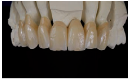
الصورة ٦: مظهر العمل المكسو جزئياً بعد الشوي التلميعي.