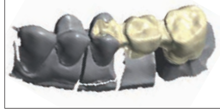
الحالة ٤: تحضير واقي للنسج الصورة ١١: تصميم فوق الشاشة بعد التحضير الواقي للنسج. جسر مصبوب من ١٥ حتى ١٧ (على مسؤولية المخبر لأنه خارج الإستطباب)