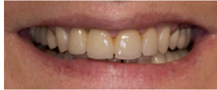
الصورة ١٠: مظهر عام لل فك العلوي من الجهة الدهليزية. لاحظ الإنسجام اللوني الممتاز لكسوة السن ٢٢.