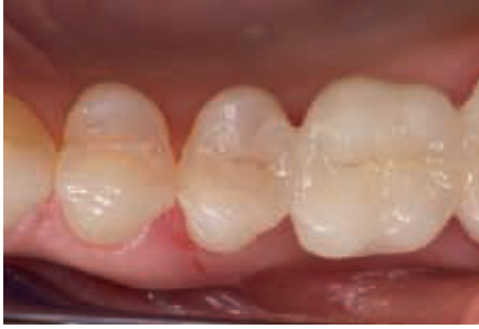
الصورة ١٤: صورة تفصيلية للجسر المصبوب.