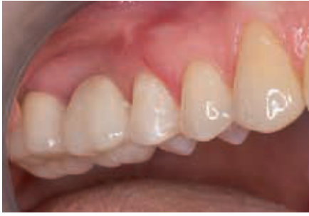
الصورة ١٣: الجسر المصبوب بعد تركيبه في فم المريض