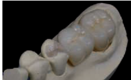
الصورة ١٢: الجسر النهائي على النموذج

الحالة ٣: جسر كامل الإكساء الصور ٨ و ٩: تلوين ملائم للمريض مع المجانسة مع سن مجاور (٢٢ غير ظاهر في الصورة) مزود بكسوة خزفية (e.max). جسر أكسيد زيركون مطبق بشكل كلاسيكي. وتظهر على النموذج بوضوح الحواف الرقيقة، وهي مساند عناصر الجسر المصوغة من Cercon لتحقيق التحمل الأكبر من قبل النسج. الصورة ٩ تظهر مسار اللون المتناسق بين الهيكل والكسوة.